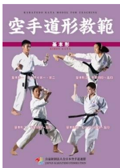
『空手道形教範 基本形』 (定価 税込4,400円、送料別)