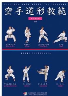
『空手道形教範 第二指定形』 (定価 税込3,300円、送料別)