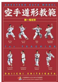
『空手道形教範 第一指定形』 (定価 税込3,740円、送料別)

※参考：審判員のコメントで、「第5 挙動の立ち方が…」等、形の動作を挙動数で説明していることがあります。挙動数は、全日本空手道連盟『空手道形教範』をご参照ください。